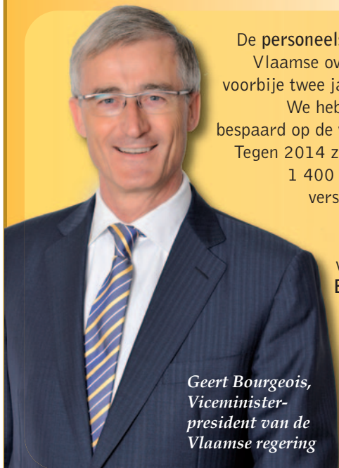
Geert Bourgeois, Viceminister- president van de Vlaamse regering

De personeelsbudgetten van de Vlaamse overheid daalden de voorbije twee jaar met 5 procent. We hebben ook drastisch bespaard op de werkingsmiddelen. Tegen 2014 zullen er bovendien 1 400 ambtenaren op de verschillende Vlaamse departementen niet stelselmatig vervangen worden. Een besparing van 50 miljoen euro per jaar!