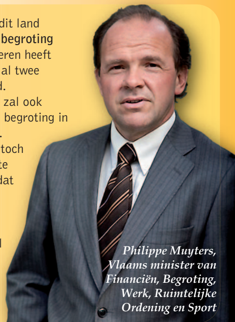
Philippe Muylers, Vlaams minister van Financiën, Begroting, Werk, Ruimtelijke Ordening en Sport

Als enige overheid in dit land heeft Vlaanderen een begroting in evenwicht. Vlaanderen heeft de voorbije twee jaar al twee miljard euro bespaard. De Vlaamse Regering zal ook de volgende jaren een begroting in evenwicht voorleggen. Als er geleidelijk aan toch wat budgettaire ruimte komt, investeren we dat zoals Europa vraagt: in onze economie (O&O, infrastructuur, werk ...) en in sociaal beleid (kinderopvang, wachtlijsten gehandicapten, kindpremie ...).