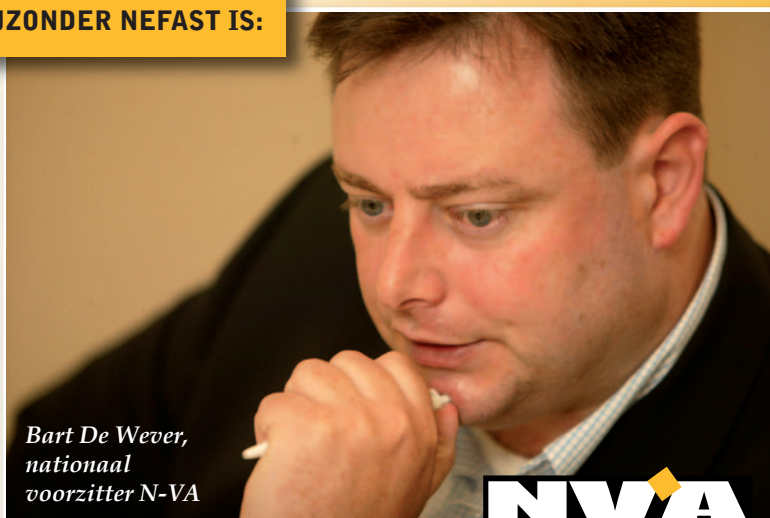
Bart De Wever, nationaal voorzitter N-VA