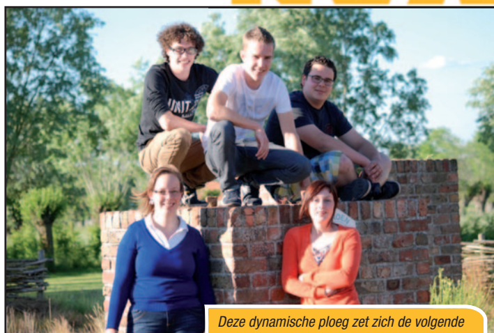
Deze dynamische ploeg zet zich de volgende jaren in voor de jongeren van onze gemeente.