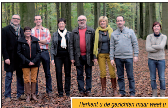
Herkent u de gezichten maar weet u de namen niet meer? Surf naar www.n-va.be/houthulst .

Onderstaande foto uit ons vorig huis-aan-huisblad kan u ongetwijfeld wat helpen.