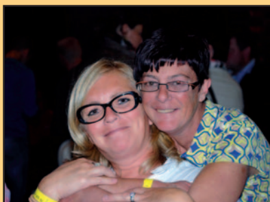
Fotoreportage Vlaamse kermis