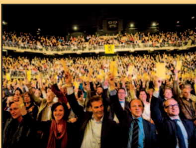
N-VA aan het roer in België en Vlaanderen

Hoe spendeert het gemeentebestuur uw belastinggeld?